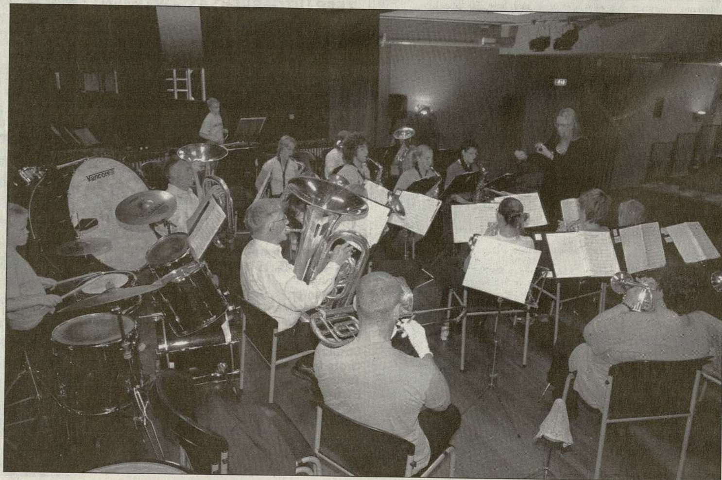
● Een van de deelnemende orkesten

Twee van de gespeelde stukken werden beoordeeld door een deskundig jury, bestaande uit een dirigent/muzikleraar.