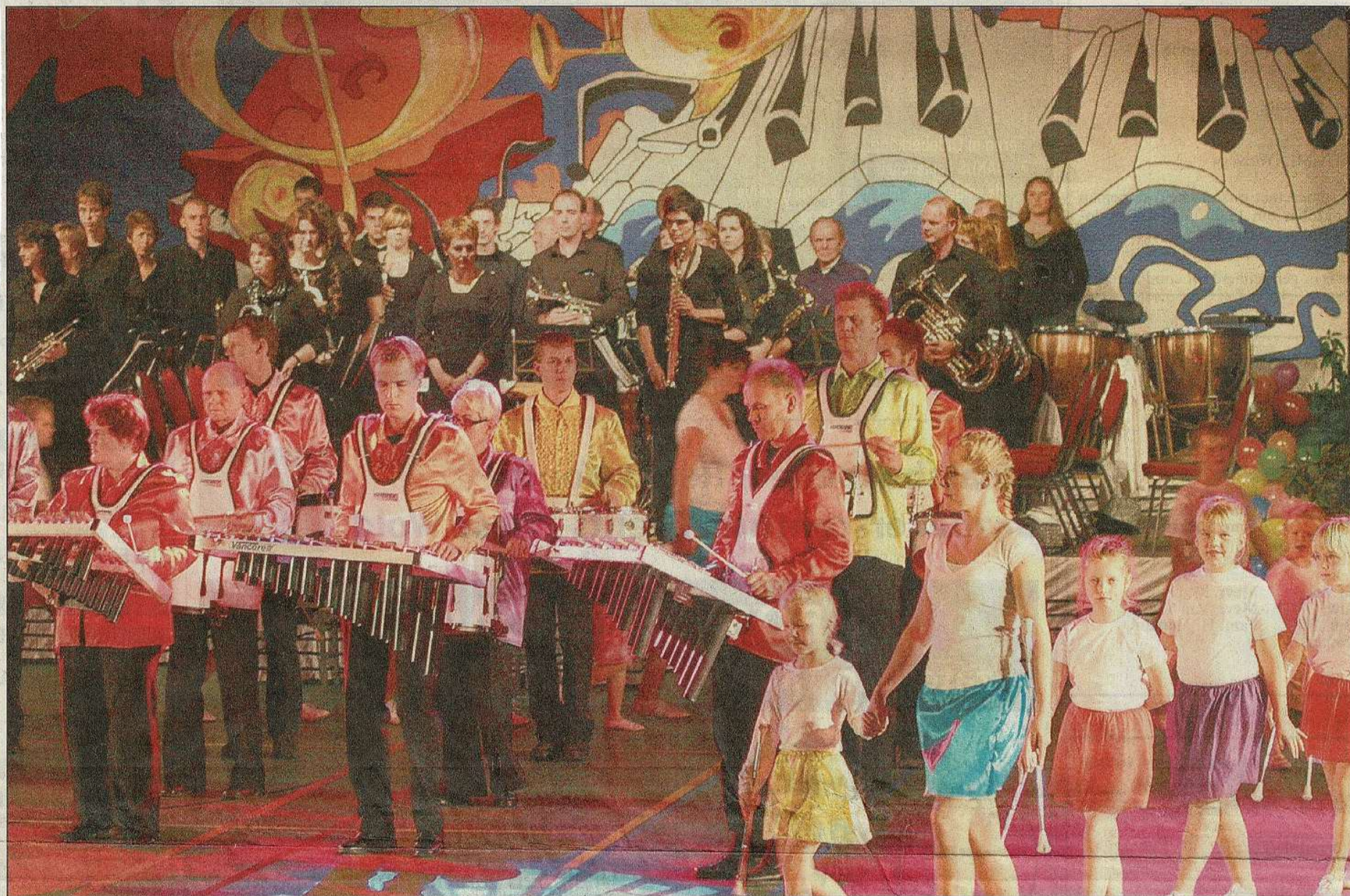
Het korps, de malletband en de showband maken van het Woudklankfestival een kleurrijk geheel.

NOORDWOLDE – Met ruim vijfhonderd bezoekers kijkt de organisatie van het Woudklankfestival tevreden terug op de vijftiende editie van het muzikale spektakel. Sporthal De Duker puild zaterdagavond uit tijdens de show 'Sounds & Colours'. Deze titel liet niets te wensen over. In kleurige kledij betraden de negentig leden van de Woudklank in verschillende settings het podium.