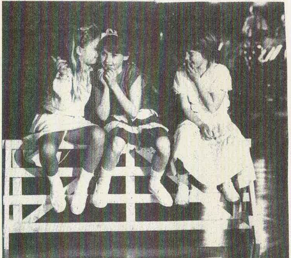
„Drie kleine kleutertjes”, vertederend uitgebeeld door de minirettes. „Waarover spraken zij?”

Het laatste element in het door Titus de Boer deskundig gepresenteerde programma werd aangedragen door het Gemengd Koor Boijl o.l.v. Wilt Post. Als gebruikelijk zorgde het koor voor een gave inbreng, daarmee samen met De Woudklank onderstempelend dat de Oosthoek van Weststellingwerf op muzikaal gebied een respectabele naam heeft opgebouwd.